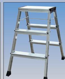
Nr katalogowy 130068